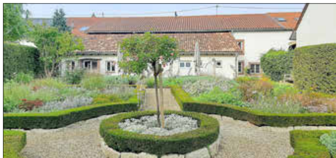
„Duft- u. Würzgarten“: Der Duft- und Würzgarten lädt auch in diesem Jahr wieder zur Veranstaltung „Rendezvous im Garten“ ein.

Das detaillierte Programm gibt es im Internet auf www.kreis-saar-louis.de .