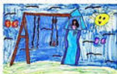
Ein schönes Projekt zur Gestaltung von Hinweisschildern für die Spielplätze in Wallerfangen neigt sich leider dem Ende zu.

„Viele kleine Leute, die an vielen kleinen Orten viele kleine Dinge tun, können das Gesicht der Welt verändern.“ (Afrikanisches Sprichwort)