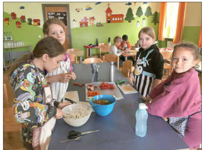
Die Zubereitung des Schnittlauchquarks