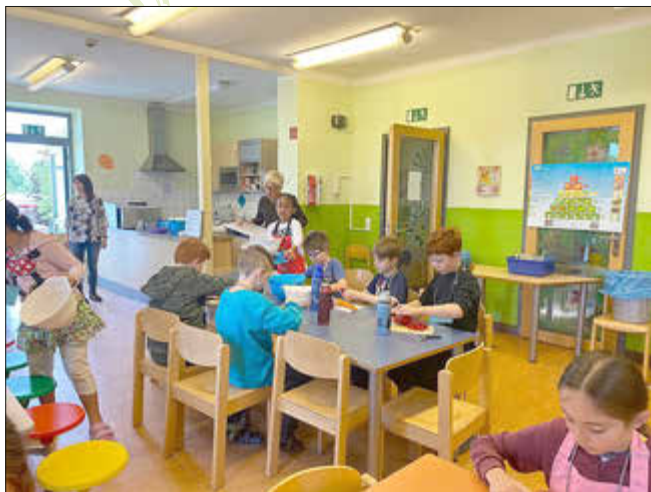
Alle sind eifrig am Arbeiten